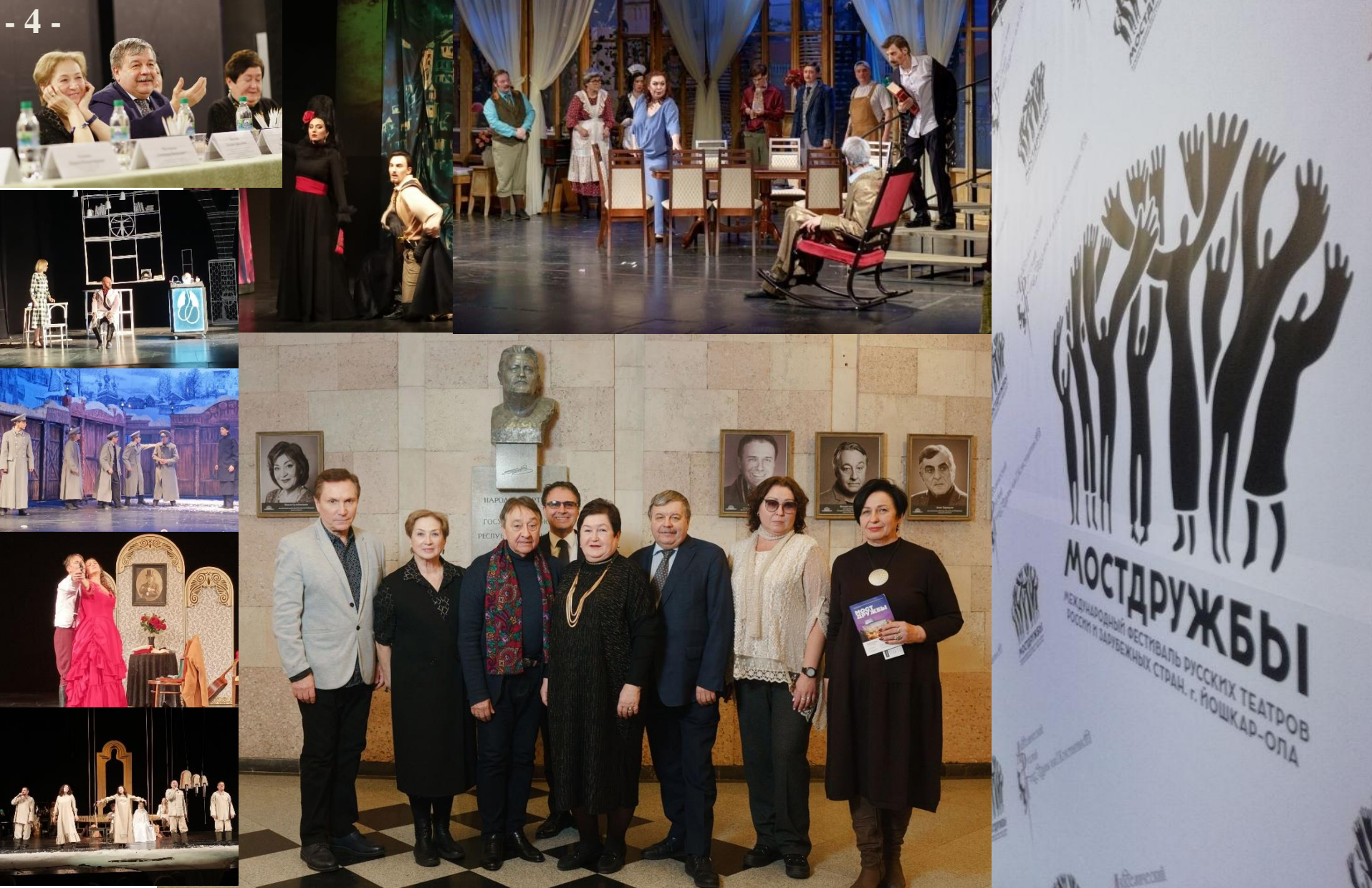
Работа в составе экспертов Международного фестиваля русских театров национальных республик «Мост дружбы» (Йошкар-Ола, 2018-2023).