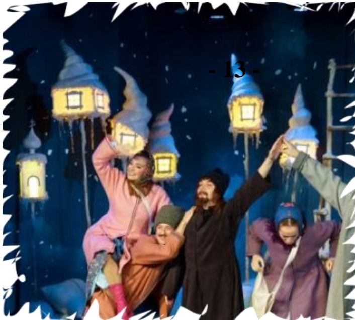
сцена из спектакля «Вечера на хуторе близ Диканьки», Йошкар-Ола, реж. И. Немцев