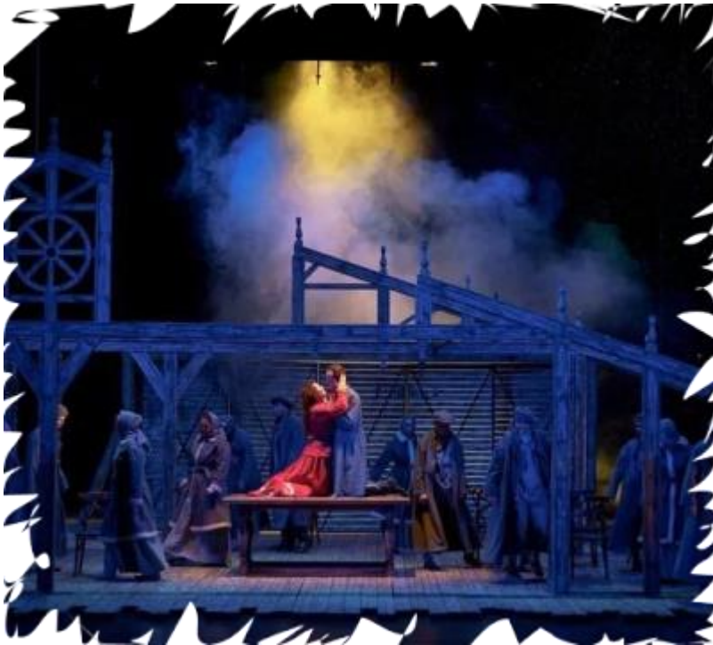
сцена из спектакля «Леди Макбет Мценского уезда», Йошкар-Ола, реж. С. Голодницкий