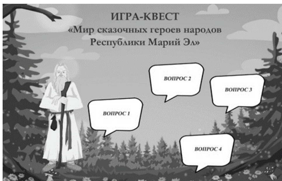
Рисунок 2 - Диалог с русским старцем

Начав игру, мы видим русского старца и четыре вопроса, которые он готов задать (рисунок 2). Кликаем на вопрос, и перед нами развернута характеристика одного из ключевых персонажей русской волшебной сказки (рисунок 3) с выбором ответа. Следует отметить тот факт, что данный проект носит обучающий характер. Поэтому после того, как игрок (участник квеста) дает ответ на тот или иной вопрос, ему не только сообщается правильный ответ, но и предлагается развернутый комментарий и подсказка, в случае неправильного выбора.