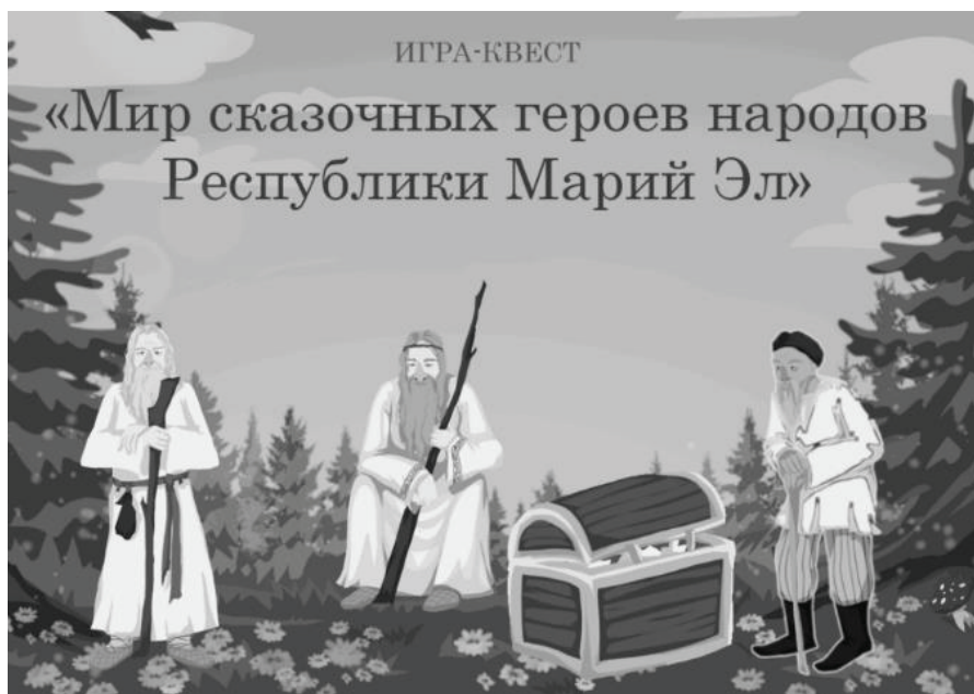
Рисунок 1 - Иллюстрация начального этапа игры

диалог с русским, далее с марийским, а затем с татарским старцем (рисунок 1).