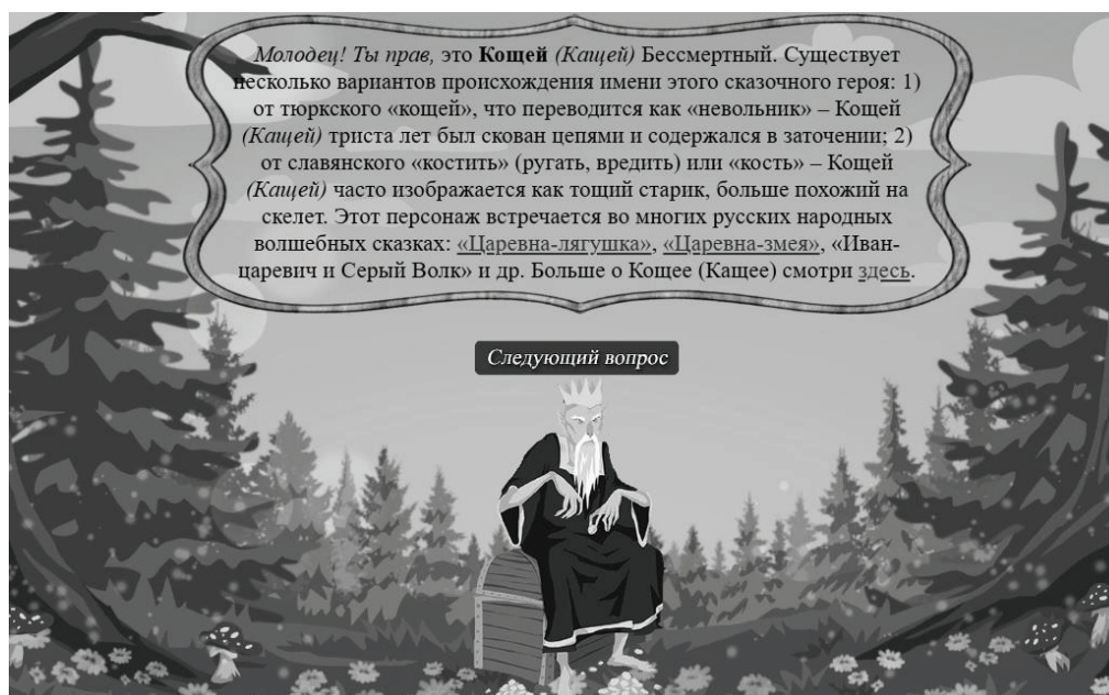
Рисунок 5 - Пример всплывающего окна при правильном ответе участника

Каждый правильный ответ в данной игре проиллюстрирован с помощью компьютерной графики, специально созданной для данного проекта 2D векторной анимацией. По этой же аналогии в игре представлены вопросы марийского и татарского старцев.