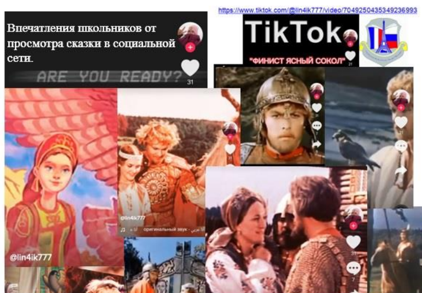
Рис. 4. Видеотзывы обучающихся гимназии на платформе TikTok

молодца) [7]. Всё началось с прочтения сказки-пьесы Софьи Прокофьевой, Ирины Токмаковой «Финист ясный сокол» [8] и просмотра одноименного спектакля в академическом русском театре драмы им. Г. Константинова [9, 10]. Это сопровождалось разбором данных произведений как самостоятельно, так и совместно с учителем. В результате обучающиеся познакомились с понятием «сказка-пьеса», закрепили материал о драматическом произведении. Совместно с педагогом младшие школьники повторили материал о структуре волшебной сказки и попытались сопоставить сказочные сюжеты, воплощённые в различных формах. Работа над текстом сказки-пьесы и сопоставление её содержания с сюжетом спектакля позволили обучающимся не только сделать важные выводы по содержанию и идейному смыслу произведения, но и создать собственные видеотзывы на спектакль и разместить на платформе TikTok (рис. 4).