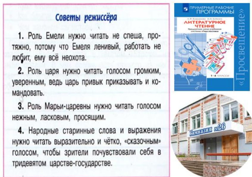
Рис. 3. Советы режиссера из творческой тетради УМК «Перспектива»

на наш взгляд, позволяет систематизировать знания обучающихся и обогащать их практический опыт.