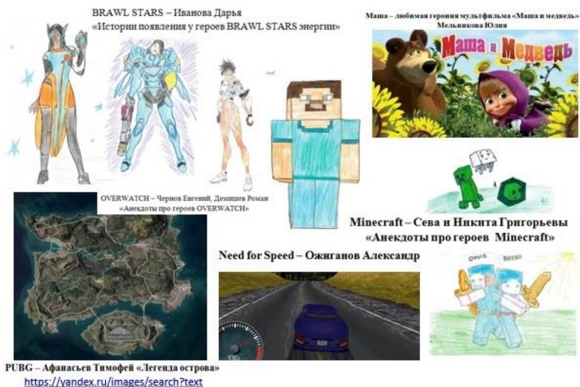
Рис. 1. Проекты обучающихся Гимназии № 26 имени Андре Мальро

Придумывание сказок и составление рассказов по аналогии с прочитанным произведением, включение в рассказ элементов описания или рассуждения; придумывание возможного варианта развития сюжета сказки (с помощью вопросов учителя) (рис. 1) – данный вид работы был реализован и представлен в рамках интернет-форума «Фольклорная культура и способы ее интерпретации в современной школе» [3].